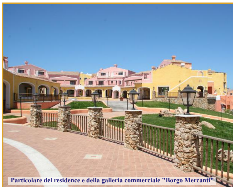
Particolare del residence e della galleria commerciale "Borgo Mercanti"