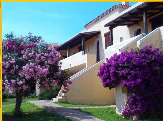
Nelle foto alcuni particolari del Residence "Le Corti di Marinella"