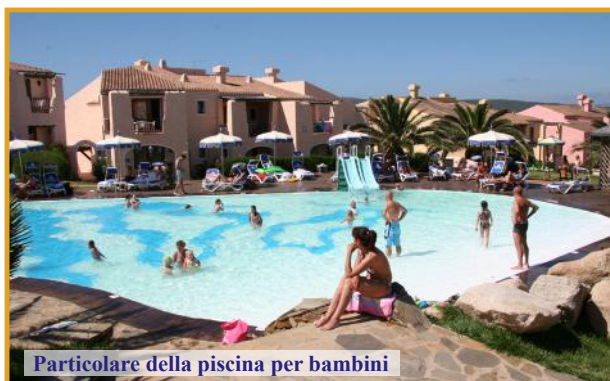
Particolare della piscina per bambini