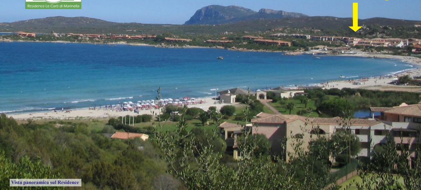
Vista panoramica sul Residence

Appartamenti in esclusivo Residence della Sardegna più vip