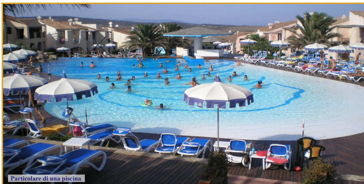
Particolare di una piscina