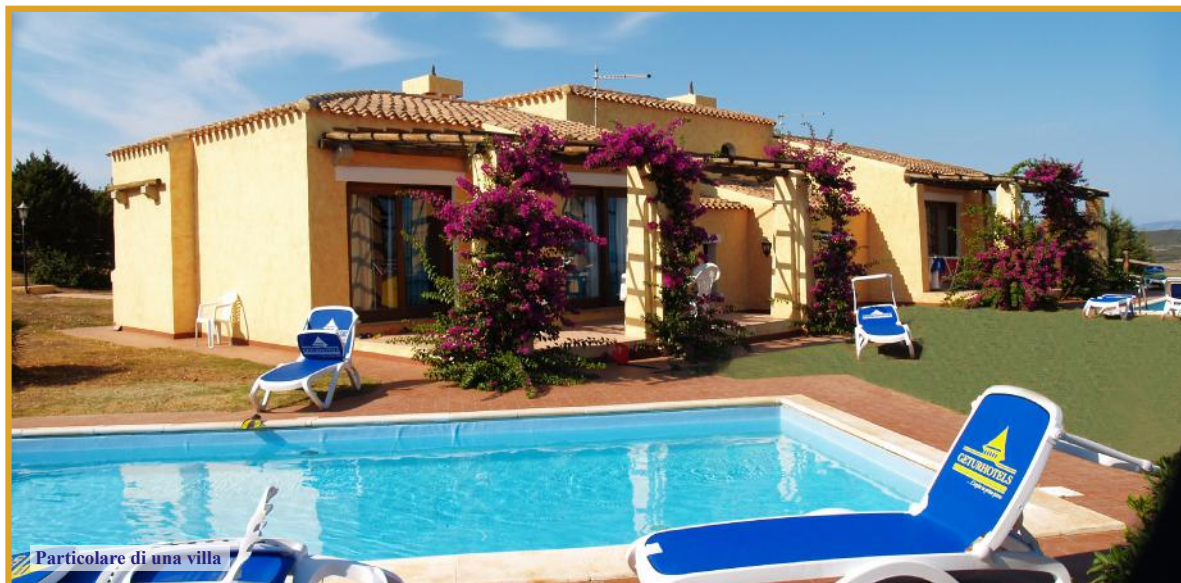
Particolare di una villa