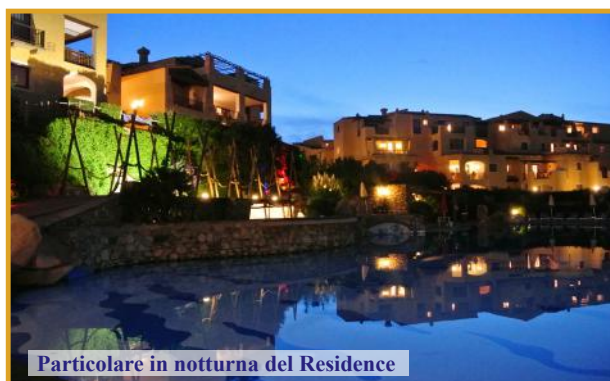
Particolare in notturna del Residence